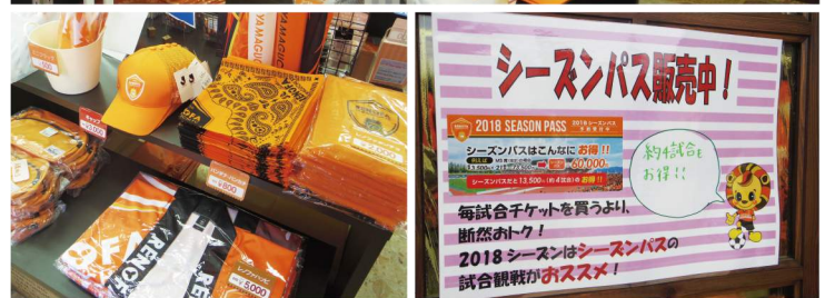
▲店内に並ぶ応援グッズの数々。お得な 2018 シーズンパスもアンテナショップにて販売中です。