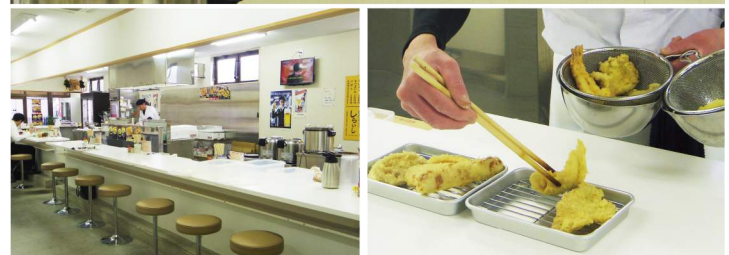
▲明るく居心地の良い店内。 揚げたてを次々と出してくれるのも、このお店の魅力です。